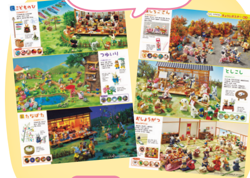
4月・10月 行事ポスター はるからなつ／あきからふゆ