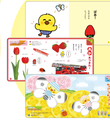
はじめて 2025年4月号より

長いページを見る集中力がないお子さんも、気に入ったページを繰り返し見ることで、絵本に夢中になれる。