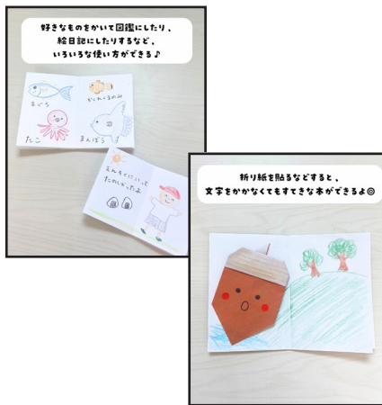
好きなものをかいて図鑑にしたり、絵日記にしたり、いろいろな使い方をしてみよう。折り紙を貼るなどすると、文字をかかなくてもすてきな絵本ができる。