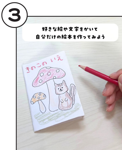
好きな絵や文字をかいて、自分だけの絵本を作ってみよう。