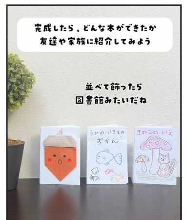
完成したら、どんな本ができたか友達や家族に紹介してみよう。並べて飾ると図書館のようになる。