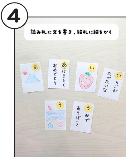
読み札に文を書き、絵札に絵をかく。