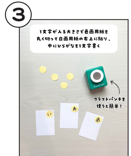
1文字が入る大きさに色画用紙を丸く切って白画用紙の右上に貼り、中にひらがなを1文字書く。クラフトパンチを使うと簡単。