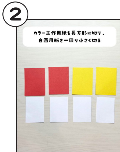
カラー工作用紙を長方形に切り、白画用紙を一回り小さく切る。