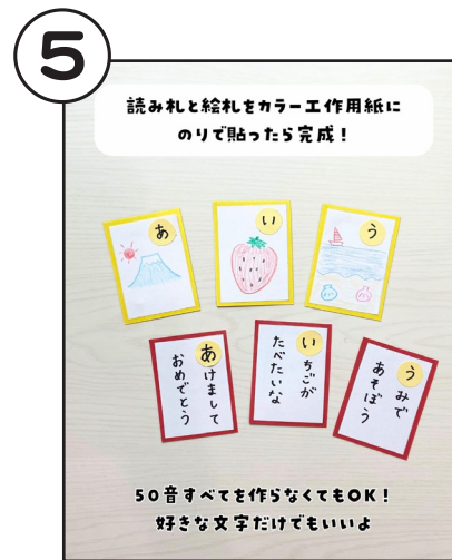
読み札と絵札をカラー工作用紙のりで貼ったら完成。50音すべてを作らなくても、好きな文字だけでもOK。