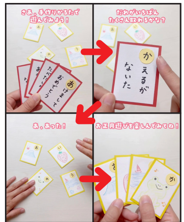
手作りかるたで遊んでみよう。だれがいちばんたくさん取れるかな。