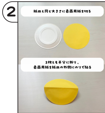
紙皿と同じ大きさに色画用紙を切る。2枚とも半分に折り、色画用紙を紙皿の外側にのりで貼る。