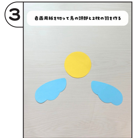
色画用紙を切って鳥の頭部と2枚の羽を作る。