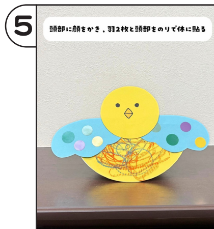
頭部に顔をかき、羽2枚と頭部をのりで体に貼る。