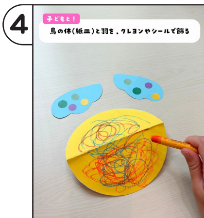
鳥の体（紙皿）と羽を、クレヨンやシールで飾る。